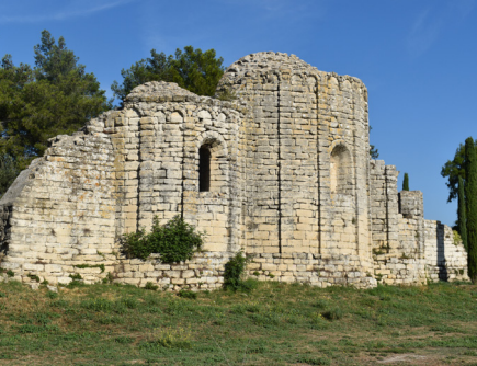
Église St Geniès