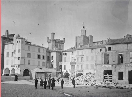
La place aux herbes