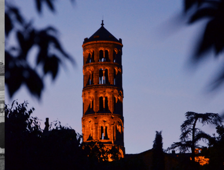
La tour Fenestrelle d'Uzès