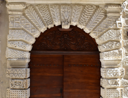
Portail de l'hôtel de Baudan