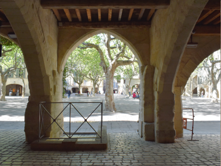
Les arceaux de la place aux herbes