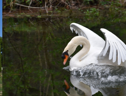
Cygne de la vallée de l'Eure