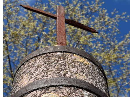
Croix de St Firmin