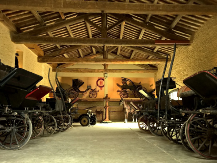
Salle des attelages ©IFCE – Haras national d'Uzès