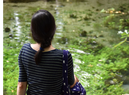
La source d'Eure