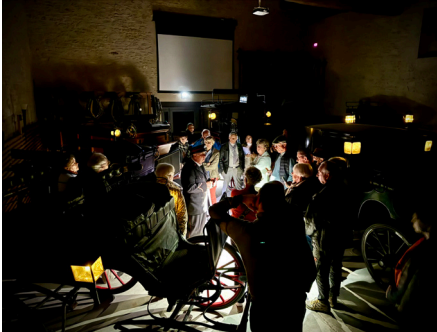
Visite nocturne ©M. Casiez - IFCE – Haras national d'Uzès