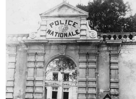
Ancien évêché