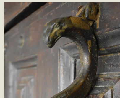
Battant de porte

Livret gratuit, disponible sur demande à la Maison du patrimoine et à l'Office de tourisme.