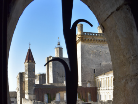
Le duché d'Uzès