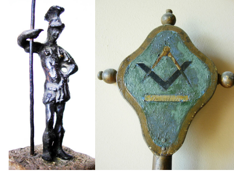
Le dieu Mars / Bâtons de procession de la corporation des maçons d'Uzès

Tarifs : plein 3€/ réduit 1,50€. Uniquement sur réservation par mail à publics-musee@uzes.fr